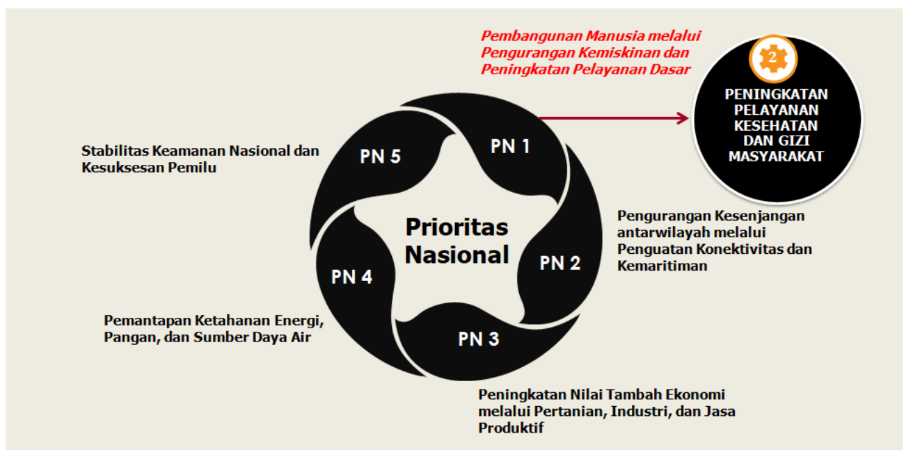
Gambar 3.1 Prioritas Nasional dan RKP Tahun 2019

Untuk mencapai prioritas nasional yang ke 1 maka bidang kesehatan dapat memberikan peran melalui peningkatan pelayanan kesehatan dan gizi masyarakat. Kemudian ditetapkan beberapa arah kebijakan antara lain :