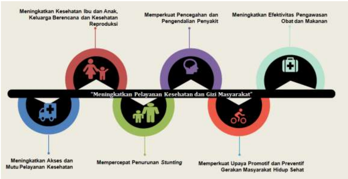
Gambar 3.2 Arah Kebijakan Program Prioritas Peningkatan Pelayanan Kesehatan dan Gizi Masyarakat

Keterkaitan arah kebijakan bidang kesehatan dengan dan prioritas nasional dapat dilihat pada gambar berikut :