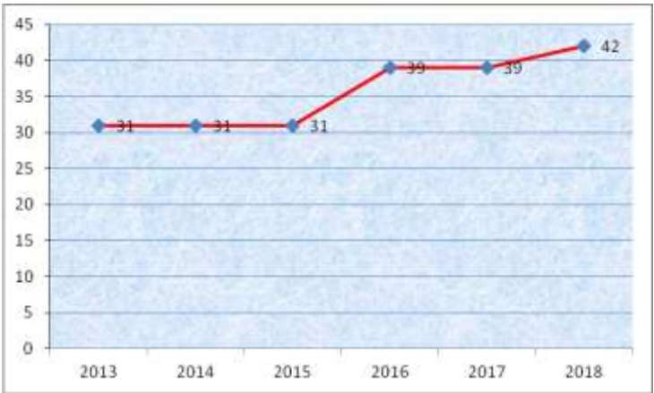
Grafik 2.1.1 Jumlah Puskesmas di Kota Bekasi Tahun 2013 s.d. 2018