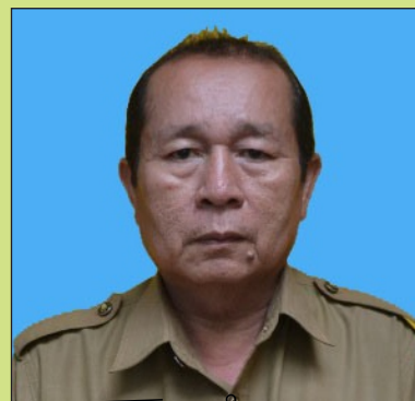
SUB BAGIAN KEUANGAN ROSID