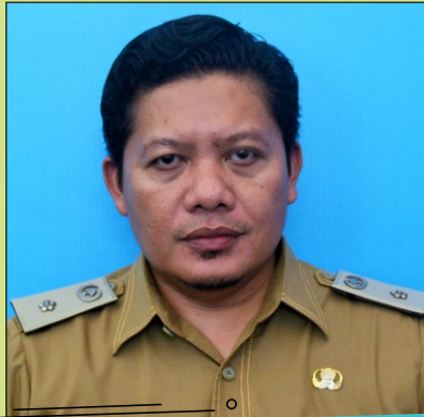
KASI PROMOSI OLAHRAGA DAN OLAHRAGA PRESTASI PRABU BR, S. STP